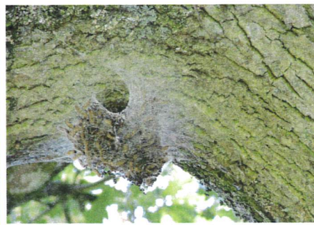
Cocon sur un chêne

La chenille processionnaire du chêne est issue d'un papillon nocturne inféodé aux chênes. Cette espèce peut causer d'importants dommages par défoliation et possède des poils urticants pouvant entraîner des réactions allergiques chez l'Homme et les animaux. D'aspect grisâtre avec la tête noire, cette chenille est fortement velue.