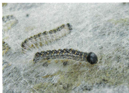
Chenille au stade L4